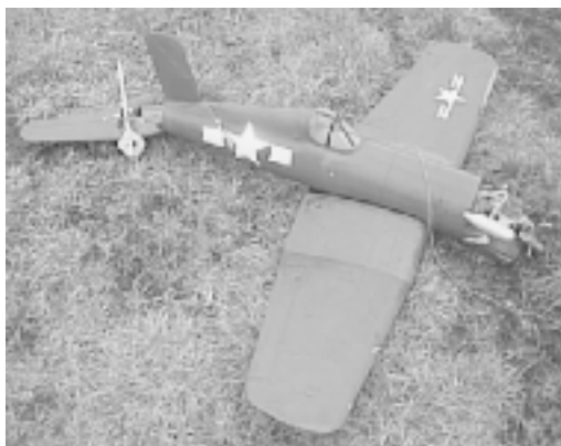
Taas tuli paikkaitavaa...

Timon Lennokki ja vapaa-aika 0400-581 831